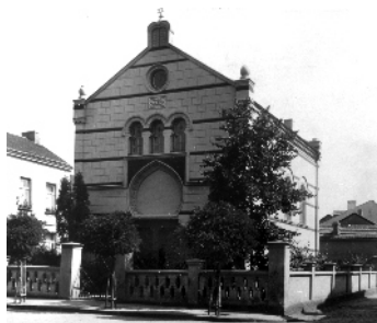
Die Remagener Synagoge 1905