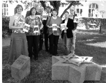
Mitglieder des Arbeitskreises "Stolpersteine" vor dem Remagener Mahnmal mit dem Flyer "Gedenken und nicht vergessen" im April 2007

Stolpersteine sind inzwischen in vielen Orten Deutschlands und auch im Ausland gesetzt worden. Die Stadt Remagen ist die erste Stadt im Kreis Ahrweiler.