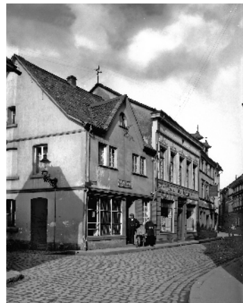
Haus Meyer Ecke Bachstr./Kirchstraße